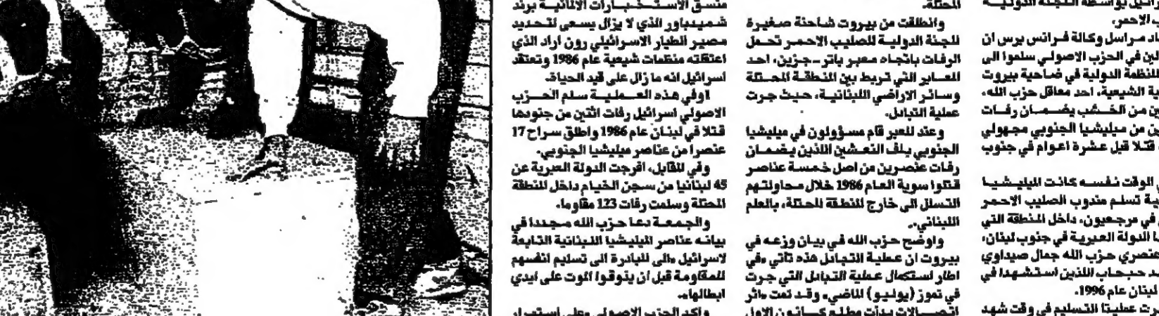
أعضاء من حزب الله لدى تسليمه جثتي جنديين اسرائيليين للصليب الاحمر الدولي لس في عملية تبادل مع جيش لبنان الجنوبي